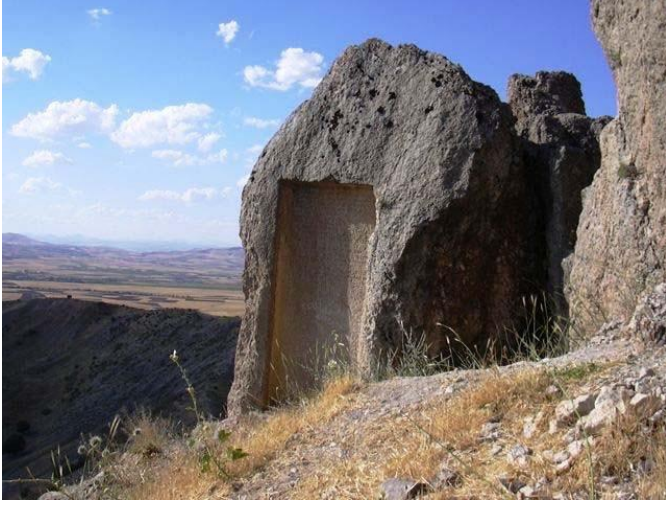
Resim 2: Kral Menua'nın Palu kaya yazıtı, Murat Nehri'nin sağ kıyısında Palu bölgesinden yaklaşık 1 km uzaklıktadır (Ayman 2013: 332).

Alzi'ye yönelik bu sefer ve Urartu egemenliğinin pekişmesi, batıda Fırat-Murat Bölgesi'ne doğru diğer seferlerin de önünü açmıştır. Palu yazıtından da öğrendiğimiz gibi, Menua Sebeteria'yı, klasik kaynaklardaki Sophene ülkesini işgal etmiş ve Malatya kralını haraç ödemeye zorlamıştır. Bu da Menua'nın Fırat'ı geçmiş olduğunu gösterir. Bu tarihten itibaren Murat su yolu Urartu'nun batı sınırını oluşturacaktır. Supani'nin ele geçirilmesi ve Hitit Bölgesi'ne girilmesi mantiken Alzi Seferi'nin ardından gerçekleşmiş olmalıdır. Dolayısıyla Alzi, batıya yönelik seferler için önemli bir üs olmuştur (Salvini 2006: 60).