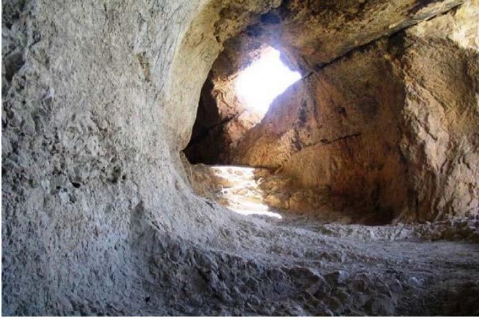
Resim 3: Palu kaya tüneli (Ayman 2013: 332).

İkinci kaya tüneli, doğrudan Murat Nehri'ne inmektedir. Tünel, kalenin güneyinde ayakçakların başladığı kayaların hemen üstünde açılmıştır. Zamanla oluşan toprak dolgu nedeniyle sadece dar ağzı görülebilmektedir. Kaya basamakları ise, ana kayaya usta bir biçimde oyulmuştur (Yapıcı 2004: 184). Basamakların doğu kolunun büyük bölümü ayakçakların devamı şeklindedir. Ancak batı tarafındaki basamaklar daha nitelikli bir işçilikle yapılmıştır. Burada basamaklar doğrudan suya iner ve tam bir merdiven görünümünde olup rahat bir inişi vardır (Çevik 1996: 21). Tüneller kalenin su ihtiyacını karşılamak için yapılmıştır.