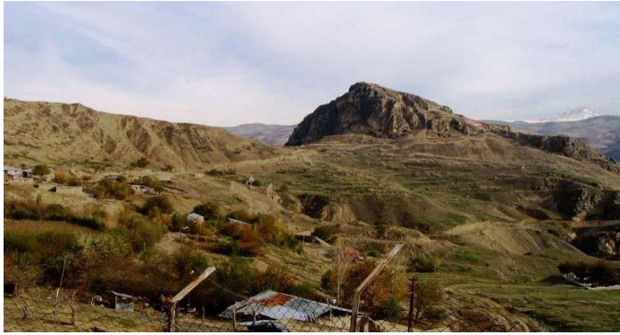
Resim 1: Palu genel görünüm (Ayman 2013: 328).

Şebeteria bölgesinin bugünkü Palu ya da biraz daha batısına karşılık geldiği genel olarak kabul edilmektedir (Çilingiroğlu 1994: 63, Payne, Sevin 2001: 111). Bizde, hem yazıttaki bilgilere bakarak hem de stratejik ve coğrafik konumunu göz önüne alarak bu genel kanaati benimsedik. Oldukça dik, kalkerden bir kayalık üzerine kurulmuş olan Palu’nun kuzeyi, doğusu ve güneyi uçurumlarla sınırlanır (Resim 1) (Ayman 2013: 328).